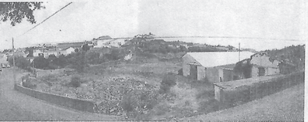
DEPOIS das demolições/área a intervir