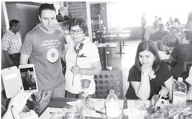
Confraternização à volta da mesa