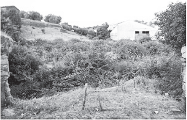
Em meados de Julho a "sala de visitas de Cebolais" está assim!