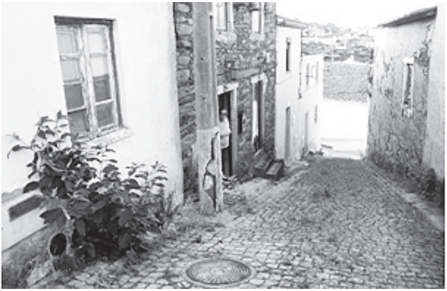
O corta-erva não passou pela Trav. Alegria