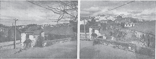
ANTES das demolições

LATADA (Cebolais de Cima),- um DESAFIO à criatividade, à imaginação e à competência dos Serviços Técnicos da Câmara Municipal de Castelo Branco