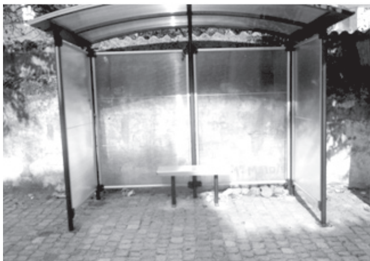
Paragem de autocarros - quantos passageiros caberão no banco?