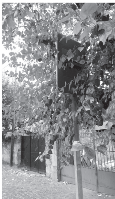
Sinal escondido - que sinal (informação) a folhagem está a tapar?