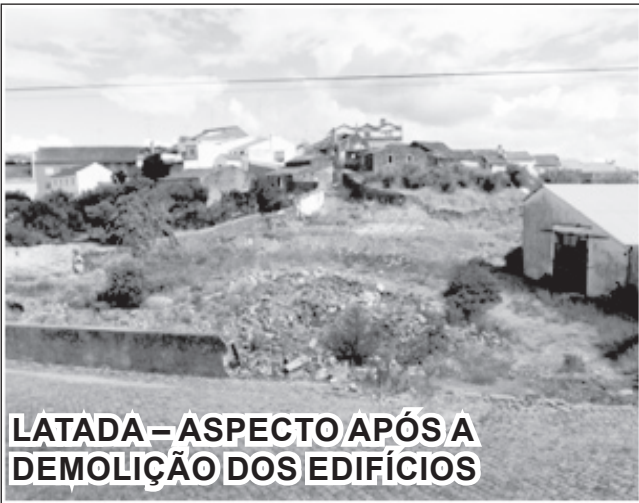
LATADA – ASPECTO APÓS A DEMOLIÇÃO DOS EDIFÍCIOS

Não há bem que sempre dure nem mal que sempre se ature, ouvi eu dos mais velhos! Também as obras de reparação do pavimento do ADRO de Cebolais de Cima tiveram, finalmente, a sua hora e nos tempos mais próximos não haverá o risco de quedas, pés ou pernas torcidos ou partidos. É pena é que o autor do projecto de obra para este espaço e de todo o adjacente e envolvente da igreja matriz tivesse uma imaginação criadora tão pouco criativa e não tivesse oferecido a Cebolais e às suas gentes um espaço de lazer agradável e convidativo idêntico a tantos outros que vemos em povoações vizinhas. Será que Cebolais não merece melhor? Que irá surgir no espaço LATADA!?