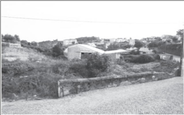
LATADA, HOJE EM DIA (MATO E ÁRVORES INFESTAM A ÁREA)