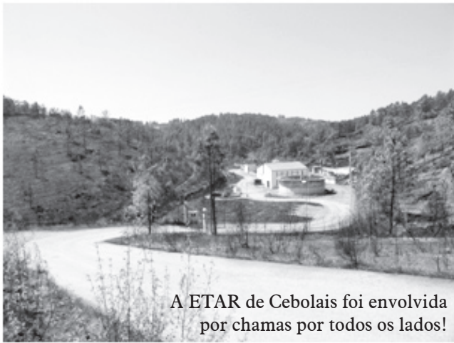
A ETAR de Cebolais foi envolvida por chamas por todos os lados!