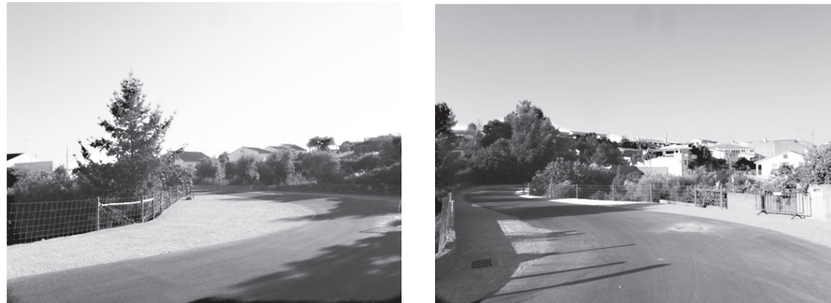
alertamos para idêntica necessidade na Avenida 25 de Abril (início da Rapoula, em frente ao velho lagar)

CONGRATULAR é sempre agradável, SUGERIR ou ALERTAR é apenas tentar ajudar naquilo que nos parece seria adequado! Se congratulamos a Autarquia e a Junta pelos trabalhos de renovação de ruas e colocação de vedações de protecção de taludes (Rua da Fonte Nova)