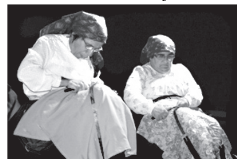
as paliteiras (profissão em extinção)